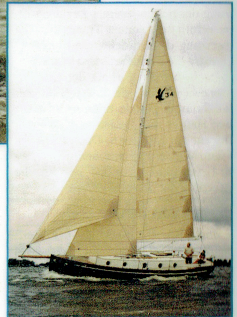
Auf Wunsch des Eigners ist die erste Puffin 36 abweichend zur Serie ohne Deckshaus gebaut worden