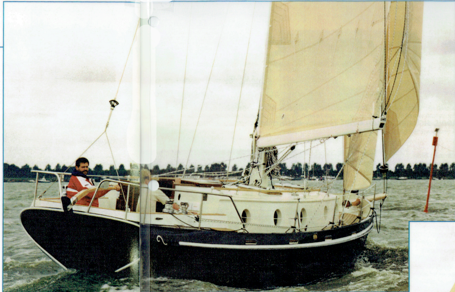
Autor Carsten Rendigs an der Pinne des Prototyps der Puffin 36 zusammen mit dem Konstrukteur